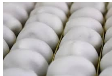
Zoom du contenu !