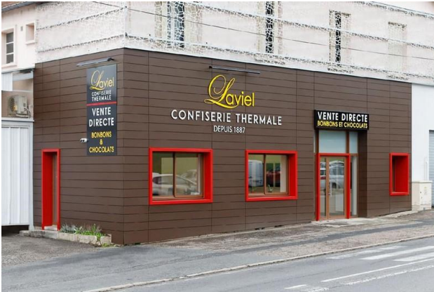
Entrée de la Confiserie Thermale au 53 Route de Paris à Cusset (03200)

La première étape est consacrée à la visite de la Confiserie Thermale, entreprise créée en 1887 par Marc Simonet (1860-1931) et spécialisée en pâtes de fruits, bonbons de sucre cuit et chocolats.