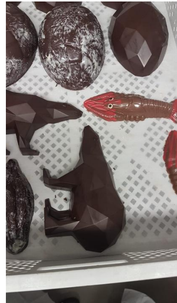
Moulages en chocolat

Après avoir déambulé dans les ateliers de production aux odeurs sucrées, et effectué quelques achats en boutique, nous nous acheminons vers le lieu du déjeuner : « Au Fidèle Berger », 24 Rue du Président Wilson à Vichy. Ancienne confiserie Coutière et Cie durant trois générations, elle est depuis 1989, un salon de thé-brasserie où il fait bon déguster quelques douceurs tout en admirant les plafonds et les enseignes d'origine.