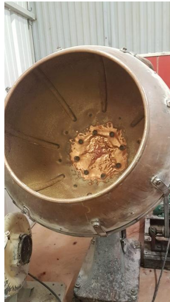
Turbine à dragées