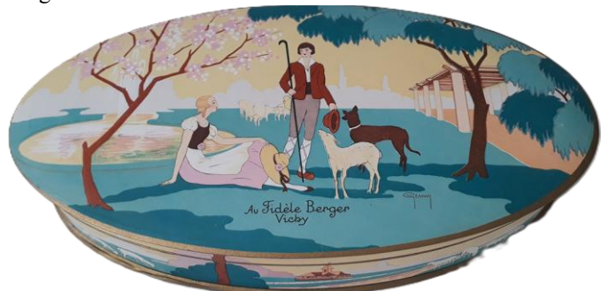
Boite ovale illustrée d'une scène champêtre comportant un pâtre et une bergère