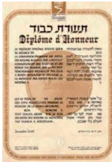
Les Justes parmi les Nations